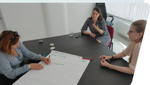
Szakértők a szlovén és cseh tapasztalatok megvitatásával segítenek a magyar kihívások leküzdésében.

Az eszmecsere során a résztvevők számos Igazságos Energetikai Átmenet projektet látogattak meg Zasavjében: egy természeti környezetben regenerált egykori bányászati területet, Szlovénia legnagyobb, 3 MW teljesítményű naperőművét, a Dewesoft csúcstechnológiai vállalatot, az ország legsikeresebb üzleti start-up inkubátorát, a Katapultot, a Virtuális Bányászati Múzeumot, amely multimédiás megközelítéssel mutatja be a terület bányászatának történetét, valamint Hrastnik önkormányzatát és annak közösségi energiaprogramját, amely az alacsonyabb jövedelmű lakosok támogatására irányul.