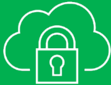
Sähköiset palvelut: talouden ja rahoituksen hallinnan raportointi- ja analyysipalvelut