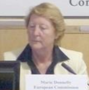
Marie Donnelly European Commissioner