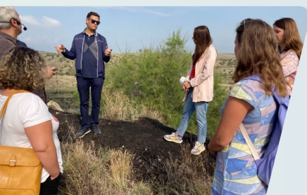
Посещение на място в открития рудник на Флорина в Западна Македония.