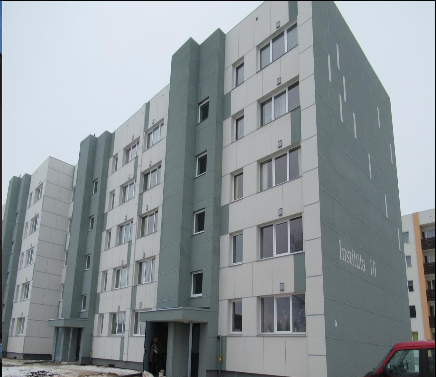
Projekta izmaksas: EUR 778 480 Patēriņš apkurei pirms: 159 kWh/m 2 Plānotais patēriņš pēc renovācijas: 52 kWh/m 2