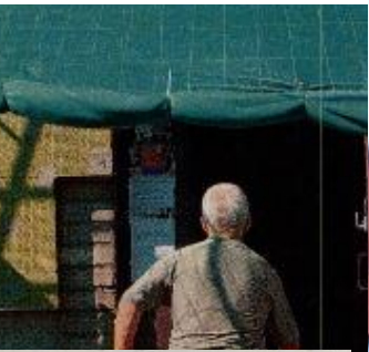
MUNDIGCIEMS - PIRMAIS NOSILTINĀTAIS CIEMS LATVIJĀ ZINĀS 18:19 noteikt kritērijus vidusskolai ir atbildīgs solis izglītības kva