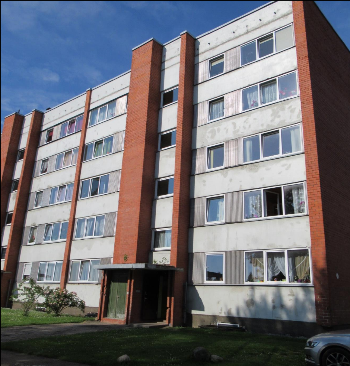
Sigulda, Institūta iela 10 103.sērija, 1979.gads 66 dzīvokļi, 4618,4 kvm