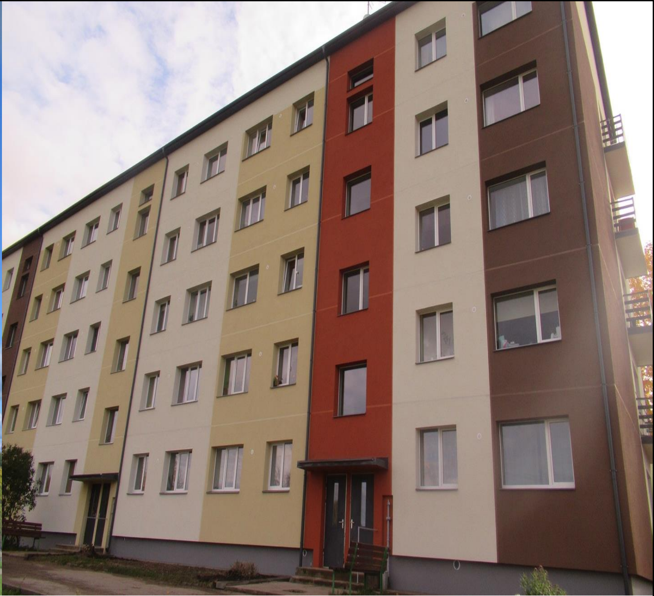
Projekta izmaksas: EUR 292 397 Patēriņš apkurei pirms: 130 kWh/m 2 Plānotais patēriņš pēc renovācijas: 51 kWh/m 2