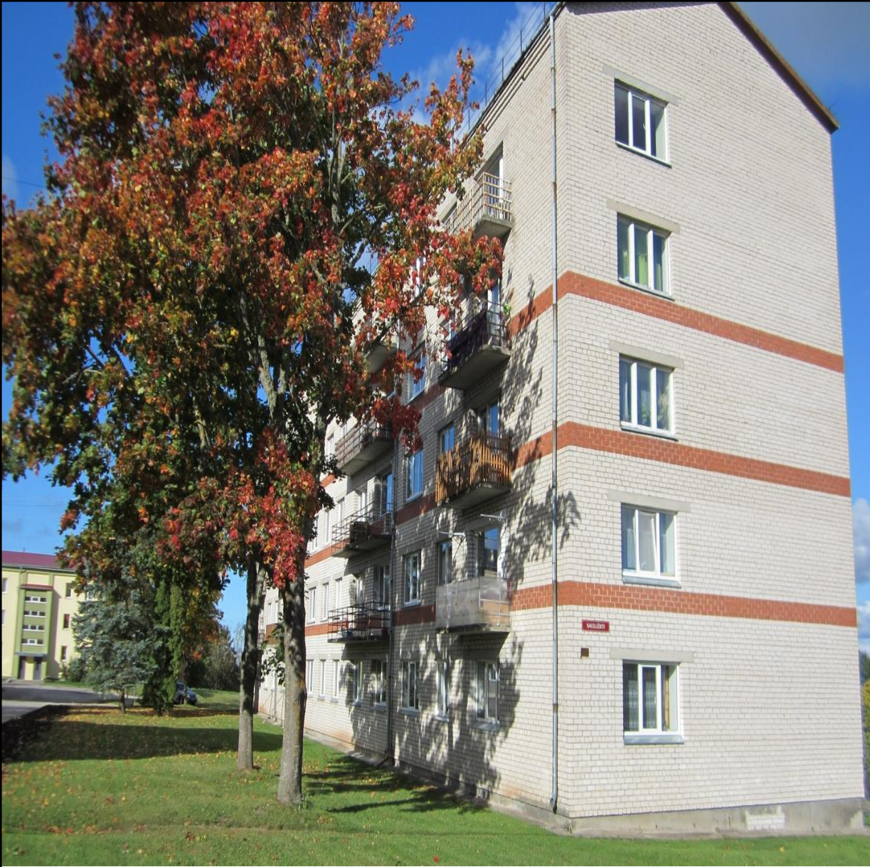
Talsu nov., Mundigciems Specprojekts, Hruščova tipa ēka 1972.gads, 45 dzīvokļi, 2462 kvm