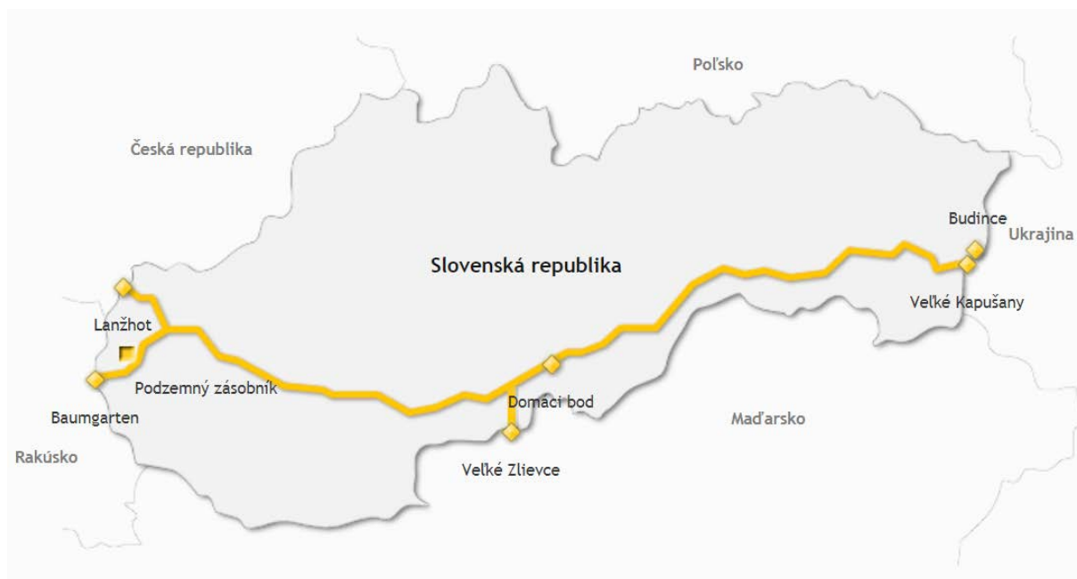
Obrázok č. 1 – Prepravná sieť spoločnosti eustream, a.s.

Na základe rozhodnutia príslušného výboru – Rozhodovacieho výboru na vysokej úrovni – v októbri 2019 nebol projekt Eastring zaradený na štvrtý zoznam PCI. EK navrhla ponechať projekty prepojenia CZ – PL, BACI ako aj Eastring mimo zoznamu PCI a zaradiť na zoznam PCI ako jediný dodatočný projekt LNG terminál v Gdaňsku. Pri projekte BACI zdôraznila potrebu pokračovania hľadania riešenia pre integráciu trhov, aj v nadväznosti na pilotný projekt TRU a pri projekte Eastring pripravenosť na budúci dialóg o prínosoch projektu.