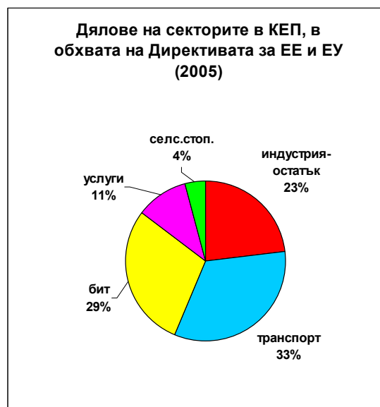
Фигура 2.5: Структура на крайното енергийно потребление в обхвата на Директивата (разпределение по сектори)

На фигура 2.5. е показано потреблението по сектори за 2005 година. За разлика от разпределението на общото крайно енергийно потребление, в което най-голям консуматор е индустрията (39%), тук в крайното енергийно потребление, в обхвата на Директивата, се вижда, че 62% от енергийното потребление е съсредоточено в секторите „Транспорт” и „Домакинства” .