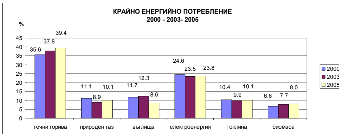
Фигура 2.4: Крайно енергийно потребление в периода 2000-2005 година.

Нарастващата употреба на течни горива и на дървесина за огрев, трябва да бъдат взети под внимание при определянето на приоритетните мерки по енергийна ефективност.