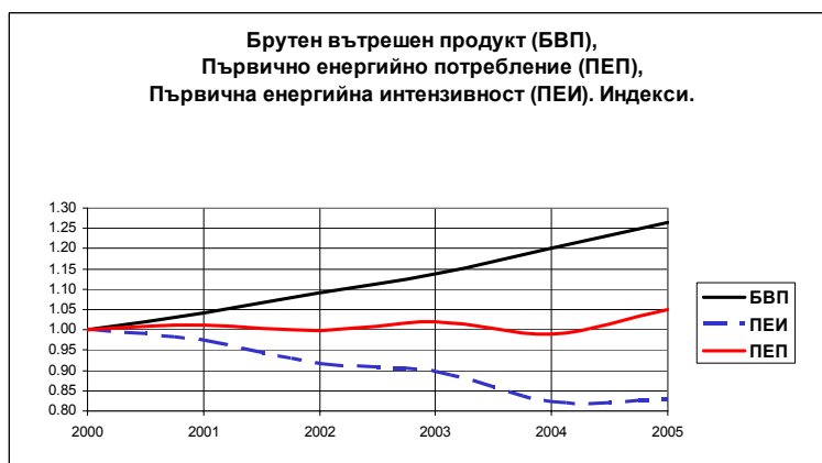
Фигура 2.3: Първична енергийна интензивност 5 – историческо развитие

Започналият процес на нарастване на потреблението на енергия в страната се обяснява с: